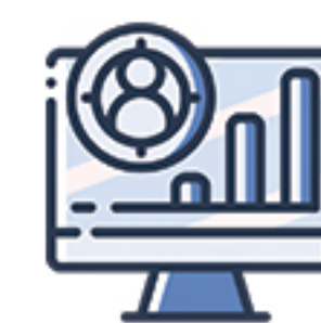
TABLEAU DE BORD DE L'UTILISATEUR