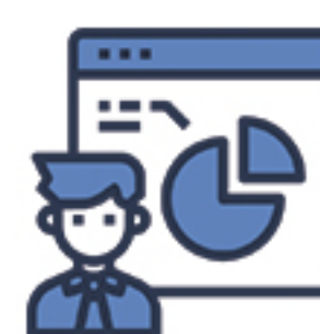
TABLEAU DE BORD DU GESTIONNAIRE